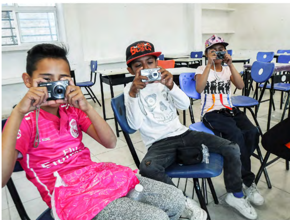
Aprendiendo el manejo de la cámara