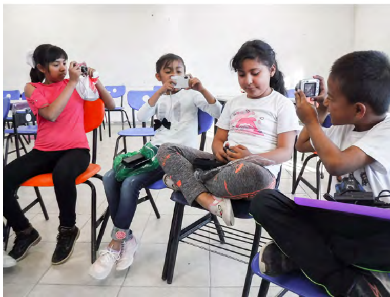
Primer día con la cámara