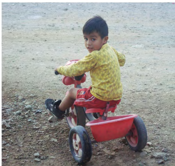
Este es mi hermano paseando en su triciclo y le encanta que le tome fotos, creo que de grande va a ser fotógrafo