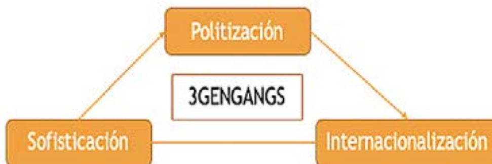
Figura 2. Modelo de evolución de bandas.

Para entender el proceso de evolución de los grupos criminales que operan en ciudades y megaciudades, es importante partir del análisis sobre el proceso de mutación táctica de las bandas, carteles y grupos del crimen organizado en la región. Al respecto, es importante destacar que, generalmente, los trabajos en la materia se han limitado a analizar a estas organizaciones desde un enfoque clásico, y únicamente se enfocan en comprender los objetivos económicos que persiguen, dejando a un lado el estudio de los elementos estratégicos y operacionales de las organizaciones criminales y sus grupos armados. No obstante, el modelo de evolución de bandas (Figura 2) y carteles de tercera generación ( third generation gangs ) es una herramienta idónea para entender el nivel de crecimiento y la influencia de estos grupos delincuenciales en el desarrollo de capacidades de control local y sofisticación táctica.