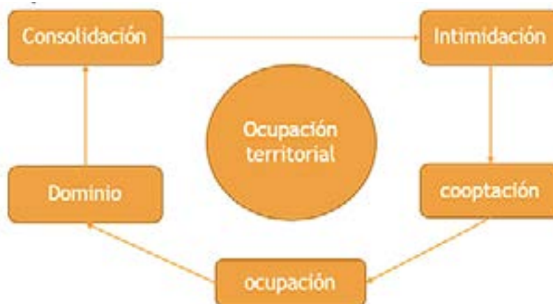
Figura 3. Proceso de empoderamiento local.

de servicios urbanos. Por ejemplo, se ha observado (Figura 3) que las pandillas locales brindan protección dentro del barrio que controlan. En cambio, las bandas criminales de segunda generación se focalizan en proteger el mercado ilícito que opera en un sector de la ciudad, creándose así modelos de gobernanza criminal.