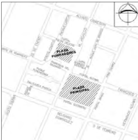
Figura 1. Plano de delimitación donde se muestra la ubicación de la Plaza Principal y de la Plaza Fundadores.

Es importante aclarar que se analizaron las dos plazas mencionadas, pero como el aspecto central de este trabajo es el paisaje, se describen las transformaciones físicas de sus colindancias.