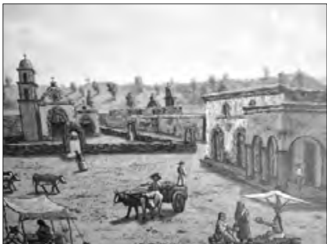
Figura 4. Dibujo del Siglo XVIII de la Plaza Mayor; donde se puede observar el convento, la parroquia del Sagrario, la capilla de la Tercera Orden, los portales y el comercio.

Al analizar la primera (Figura 4), destacan tiendas ambulantes y carretas jaladas por animales de carga; en segundo plano, los portales y la parroquia del Sagrario, la cual contaba con un atrio bardeado y la capilla de la Tercera Orden. Al fondo, al lado derecho de la parroquia —donde actualmente se encuentra la Plaza Fundadores—, la fachada del panteón.