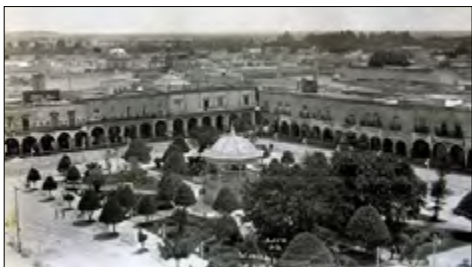
Figura 11. Fotografía de la plaza principal a principios de los años 40. Se observa el Portal Bravo antes de que se incendiara.

27 de abril de 1945, fecha en la que se incendió el actual Portal Bravo; esta catástrofe lo destruyó completamente, por lo que tuvo que ser demolido, pero se volvió a construir otro con un estilo arquitectónico completamente diferente al original (Navarro, 2010, p. 291).