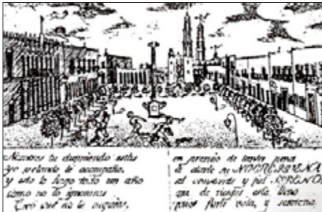
Figura 3. Grabado de la Plaza Principal de León. Fuente: Partido (1994, p. 11).

hacia ella. Se puede distinguir, también, una serie de árboles ubicados en forma de u que envuelven la plaza; al interior, cuatro faroles y en el centro un mástil. Al fondo se observa el convento 3 de los franciscanos, al lado de la parroquia del Sagrario.