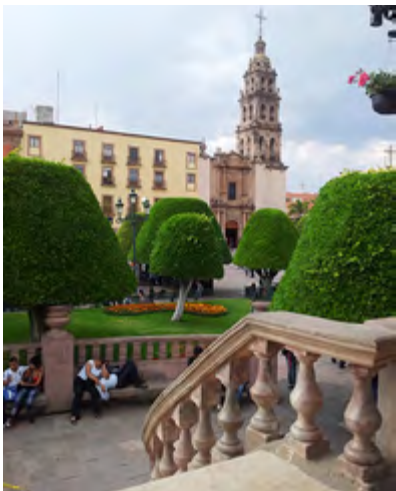
Figura 15. Fotografía tomada desde el kiosco hacia la parroquia del Sagrario. Se pueden observar las jardineras con los árboles podados en forma de cono trunco.