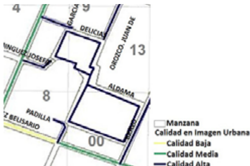
Figura 17. Plano en el que muestra la calidad urbana del centro histórico de León.

En el 2012, el IMPLAN publicó el Plan de Manejo del Centro Histórico de la Ciudad de León. Imagen Urbana y Patrimonio ; en este documento se habla, de manera general, de las condiciones del centro histórico, incluyendo a las plazas: en mal estado, falta de equilibrio entre la conservación del patrimonio y la presencia comercial, así en riesgo los inmuebles históricos (IMPLAN, 2012, p. 38); sin embargo, se pueden observar en los planos del estudio que las plazas y sus colindancias tienen alta calidad en cuanto imagen urbana.