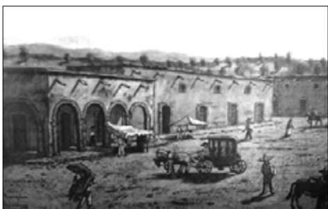
Figura 5. Dibujo del Siglo XVIII de la Plaza Mayor; donde se puede observar el estilo arquitectónico de la época, la presencia del comercio y de los portales.

La segunda (Figura 5) muestra las fachadas de los portales y de las casas habitación a nivel de paramento con una simplicidad de acceso por la plaza; se observa un segundo nivel con ventanas distribuidas de manera intercalada a las puertas y enmarcadas de manera muy sencilla. Al igual que en la primera ilustración, se contempla la vida comercial y los medios de transporte (en este caso una carroza y gente montando caballos). Al fondo se pueden ver cerros sin intervención humana.