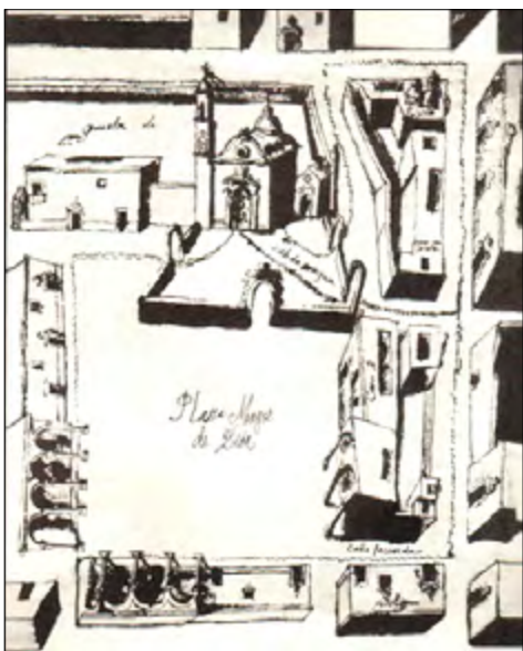
Figura 6. Primer mapa de la ciudad de León, elaborado en el Siglo XVIII, donde se muestra la Plaza Mayor; se observan los límites del atrio de la parroquia del Sagrario y la capilla de la Tercera Orden.