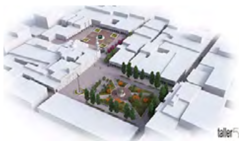
Figura 17. Propuesta de cambio de imagen y traza de ambas plazas de acuerdo con la publicación del IMPLAN denominada Estrategias de Paisaje Urbano y Operación del 1er Cuadro del Centro Histórico de la Ciudad de León, Gto.

Cabe destacar que, en caso de que se lleve a cabo este proyecto, el paisaje de ambas plazas tendría un cambio positivo, y más actualizado con las demandas sociales y ambientales de esta época, respetando el patrimonio histórico existente.