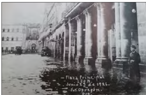
Figura 13. Fotografía de la inundación de 1926.