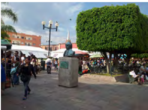
Figura 16. Plaza Fundadores. En primer plano, el busto de Miguel Hidalgo y, en segundo plano, las carpas de la Feria del Alfeñiques.

En ambas plazas se llevan a cabo eventos en distintas épocas del año, entre las que se encuentran la feria del alfeñique, a finales de octubre e inicios de noviembre, la cual se realiza en la plaza fundadores donde se colocan distintas carpas alrededor de la fuente de los leones.