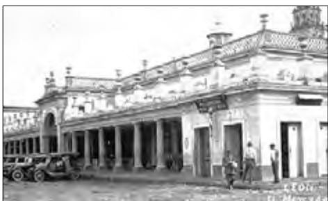
Figura 8. Fotografía del mercado Hidalgo o Parián, hoy Plaza Fundadores.

La Plaza Fundadores, a mediados del Siglo XIX, se convirtió en un hospicio y se le denominaba Plaza Menor, pero en 1864, con la visita del emperador Maximiliano, se le llamó Plaza de la emperatriz Carlota. En 1866 se derribó el hospicio y comenzó la construcción del mercado o parián, dedicado a Hidalgo; aunque la gente lo conocía como El parián o Plaza de las Delicias, debido al Mesón de las Delicias (Ojeda 2002, p. 44). Se concluyó la construcción en mismo año y se inauguró el 15 de septiembre. Contaba con un estilo arquitectónico neoclásico, con pórticos sostenidos en columnas de orden dórico (Navarro, 2010, p. 186). Un dato interesante sobre este espacio es que el Ayuntamiento se encontraba funcionando en el antiguo Mesón de las Delicias 6 y se mudó de ahí cuando la construcción del Palacio Municipal concluyó (Navarro, 1997).