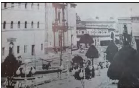
Figura 10. Fotografía de la plaza principal a principios del Siglo XX. Se puede observar el pozo artesiano frente al convento franciscano, al fondo se encontraba el mercado Hidalgo o El parían.

El Siglo XX sobresale de los anteriores, porque hubo una gran cantidad de modificaciones tanto en las plazas como en los edificios colindantes y eventos catastróficos que provocaron transformaciones radicales en el paisaje; el cambio más relevante ocurrió en 1979, cuando las calles colindantes a ambas plazas se convirtieron en zona peatonal (Ojeda, 2002, p. 54). Se construyó, también, el pozo artesiano frente al Palacio Municipal —se puede observar en la Figura 10—. En noviembre de 1913 se instalaron columnas con arbotantes y se construyó la caja acústica de cantería para el kiosco, que se mandó a reconstruir en 1914 por los daños que sufrió debido a la inundación de ese año. En 1946 se reconstruyó nuevamente el kiosco y se colocó alumbrado público alrededor de la plaza; se reparó el piso de madera del kiosco en 1953. De 1958 a 1960 se cambió el piso de toda la plaza, se mejoró la jardinería, se reconstruyó el kiosco y la luz al interior del jardín fue mercurial. Hasta finales de los años 70 el piso de la plaza era de mosaico (Navarro, 2005). Por último, en 1979 se volvió a remodelar la Plaza Principal; esta modificación estructural se conserva actualmente (Ojeda, 2002, p. 54).