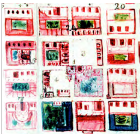
Figura 9. Mapa y plan Horizontal de la Villa de León.

El tranvía jalado por mulas, que comunicaba Estación del ferrocarril con la Plaza Principal, se inauguró el 27 de julio de 1882. Este medio de transporte modificó la visual del paisaje de ambas plazas (Navarro, 2010, p. 286). El Siglo XIX provocó grandes transformaciones físicas en el paisaje del centro de la ciudad, los cuales se pueden ver en el Mapa y plan Horizontal de la Villa de León con sus barrios, pueblos, calles y cuadras (Flores, 2007, p. 135). Si se observa detalladamente se puede percibir que el cuadrante número 3 corresponde a la actual Plaza Principal; y el 4, a la Plaza fundadores. Ambos espacios cuentan con paisaje contenido por los portales y están comunicados por la parroquia del Sagrario. En este plano, la torre del campanario aparece del lado derecho, como se encuentra actualmente. Otro dato importante al apreciar el espacio es la presencia de los corazones de manzana, los cuales han desaparecido en la actualidad para dar lugar a nuevas edificaciones y pasajes.