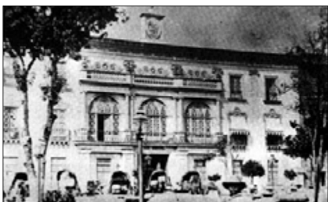
Figura 7. Fotografía de la fachada neoclásica del Palacio Municipal, al año siguiente de su inauguración. Se puede observar carros de mulas estacionados en frente.

En relación con los cambios en la Plaza Principal, el 3 de septiembre de 1892 se inició la construcción del kiosco, empezando por las columnas. En 1895, el perfecto I. Aranda informó que se había concluido la pavimentación, se habían colocado 88 elegantes bancas de fierro y se había pintado el pabellón y las banquetas circundantes (Navarro, 2005). Las colindancias de la Plaza Principal también sufrieron grandes cambios que modificaron la percepción del paisaje; en 1814, la antigua huerta de los frailes se transformó en el Colegio Grande del Seminario de los Padres Paulinos y el antiguo convento de los franciscanos fue ocupado por ellos. En 1860, esta congregación abandonó la ciudad y los edificios que desalojaron fueron expropiados en la Guerra de Reforma (Navarro, 1997); de 1861 a 1863 fueron empleados por las autoridades civiles (Frausto, 1969) y en 1866 los franceses los utilizaron como cuartel. Al restaurarse la República, se les solicitó a las autoridades federales que el antiguo Colegio Grande se convirtiera en el Palacio Municipal, petición que fue autorizada y así, de 1868 y 1869, comenzó su adaptación. El 21 de marzo de 1869 el nuevo edificio entró en funcionamiento (Navarro, 1997).