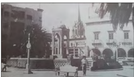
Figura 12. La fuente morisca y el Hotel México, en el Jardín de la Industria, hoy plaza fundadores.

Por otro lado, el Mesón de las Delicias se convirtió en el Hotel Guerra, después en el Hotel México y, finalmente, en 1972, en la Casa de la Cultura (Navarro, 2010, p. 293 y 313).