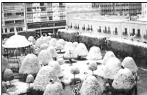
Figura 14. Fotografía de la nevada de 1997.

El 1 de agosto de 1914, la Plaza Principal fue tomada por Pascual Orozco y sus fuerzas, quienes saquearon comercios y provocaron incendios. Francisco Villa ocupó la ciudad el 17 de noviembre de 1914 y la nombró capital del estado de Guanajuato, el 29 de enero de 1915, pero Álvaro Obregón la desconoce el 10 de mayo de 1915 (Navarro, 2010, p. 289). Ocurrió un evento natural inédito el 13 de diciembre de 1997: cayó la primera nevada de la cual se tenga registro; esto provocó que el paisaje luciera completamente diferente: se cubrieron de blanco las copas de los árboles, el kiosco y las grandes jardineras de la Plaza Principal (Navarro, 2010, p. 20).